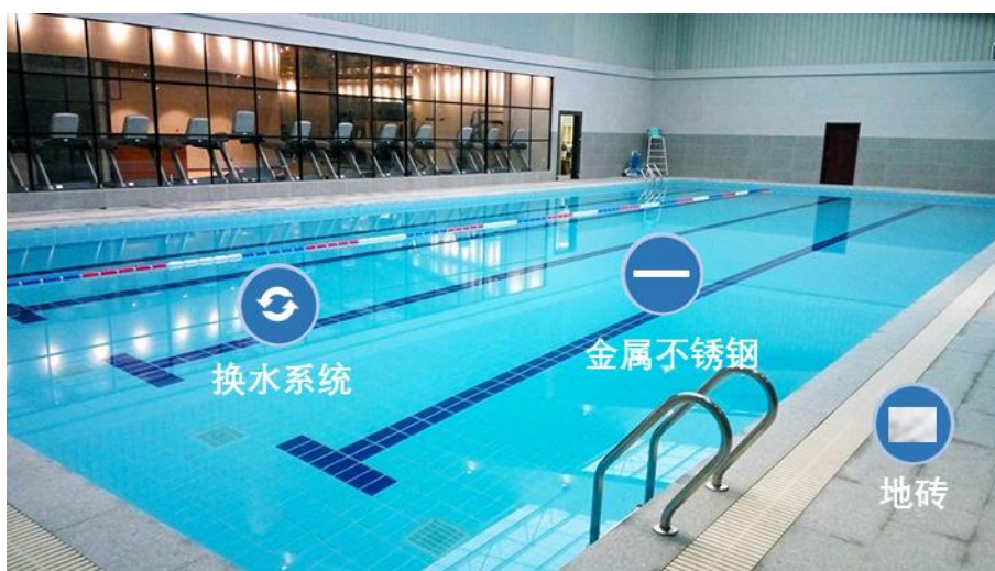
图A.4 会所2（泳池）应用示意图