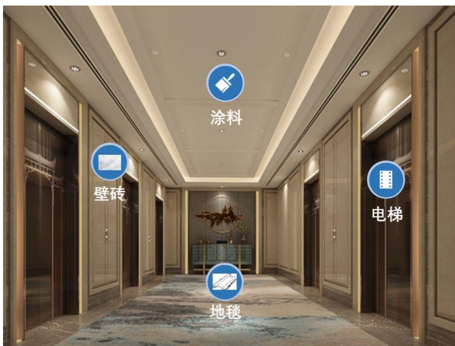
图A.5 电梯应用示意图