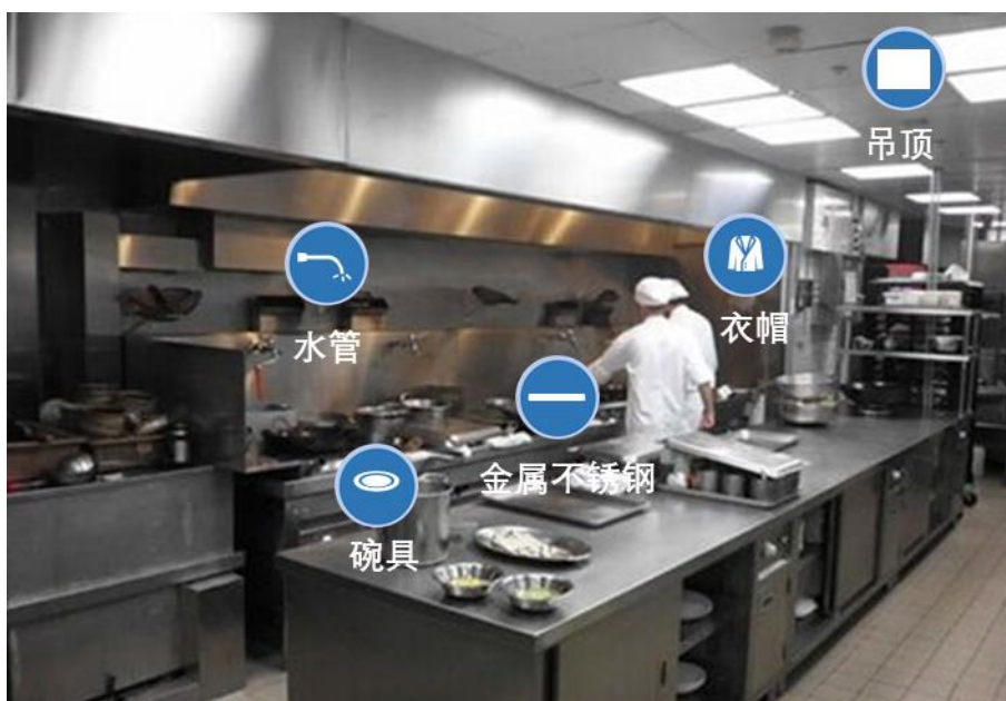
图A.2 厨房应用示意图

会所相关场景主要应用抗菌防霉产品包括墙面（含壁纸）、吊顶、地毯、家具、台面、健身器材、窗帘、公用纺织品开关/插座、地板（含踢脚）、空调等；具体参见图A.3和图A.4。