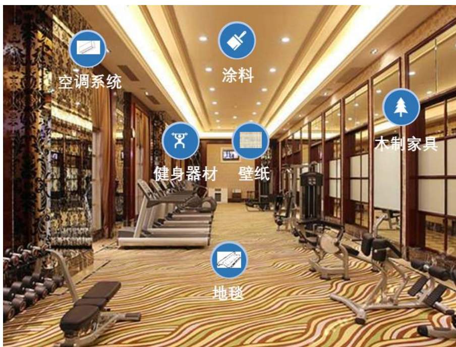
图A.3 会所1（健身场所）应用示意图

会所相关场景主要应用抗菌防霉产品包括墙面（含壁纸）、吊顶、地毯、家具、台面、健身器材、窗帘、公用纺织品开关/插座、地板（含踢脚）、空调等；具体参见图A.3和图A.4。