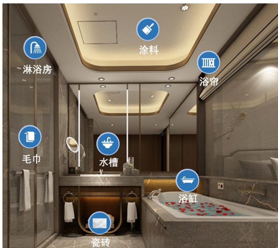
图A.7 客房卫生间（含浴室）应用示意图

客房卫生间（含浴室）主要应用抗菌防霉产品包括墙砖、地砖、吊顶、洗手池及下柜、上水管、马桶、电热水器、淋浴房、浴帘、排气扇、密封胶等。具体参见图A.7。