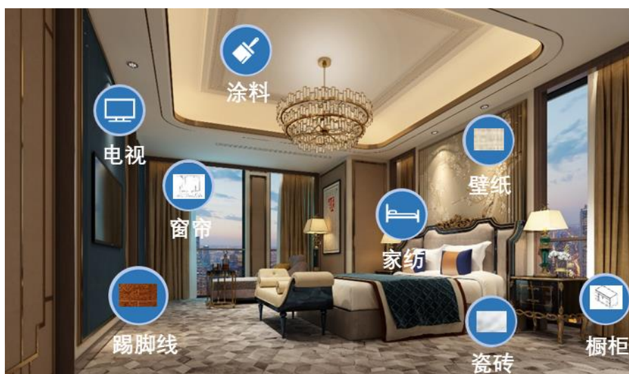
图A.6 客房应用示意图

客房卫生间（含浴室）主要应用抗菌防霉产品包括墙砖、地砖、吊顶、洗手池及下柜、上水管、马桶、电热水器、淋浴房、浴帘、排气扇、密封胶等。具体参见图A.7。